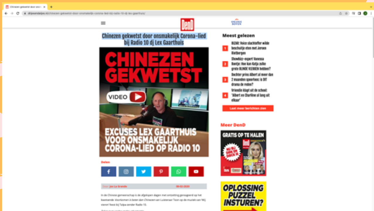
Screenshot 1: Screenshot van de website ditjesendatjes over het 'Chinese' Coronaliedje