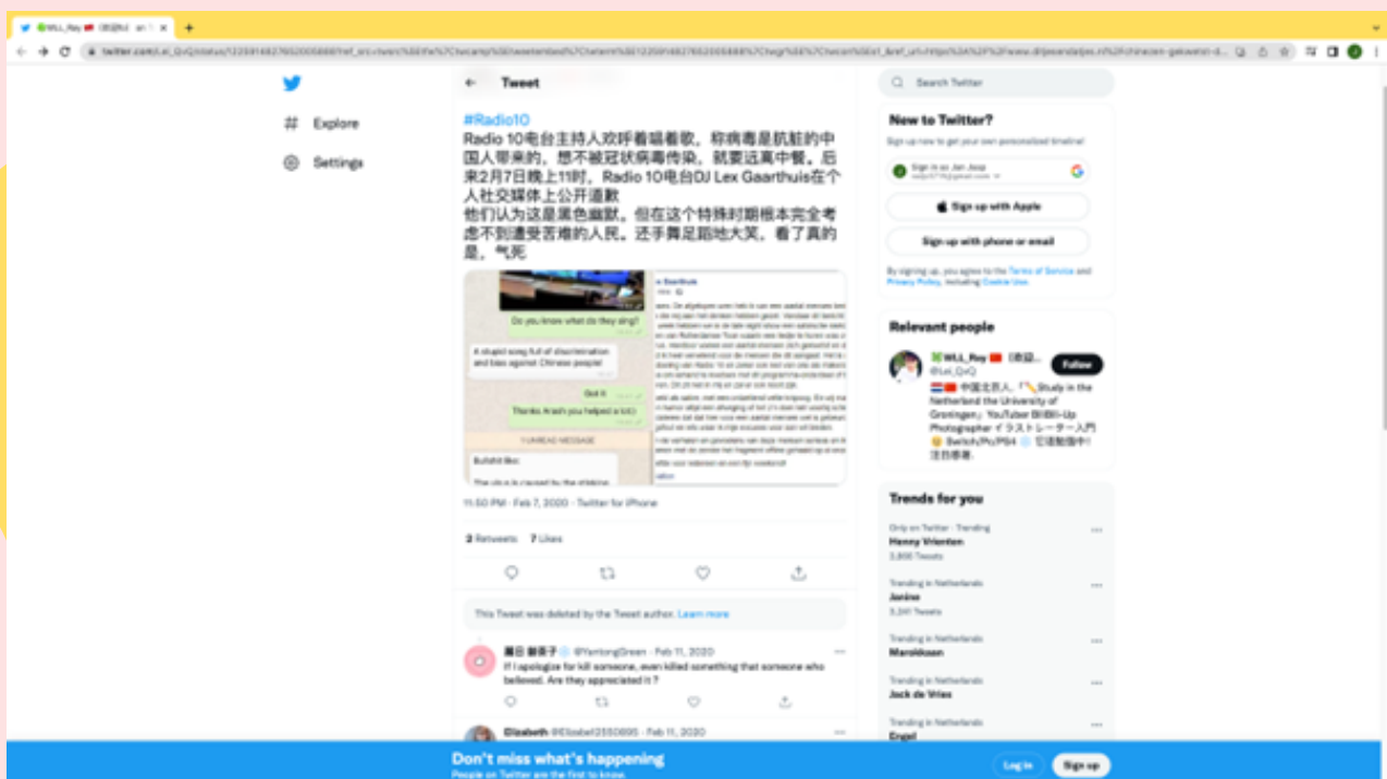
Screenshot 3: reactie op Twitter van Twitteraar WLL_Rai

WLL_Rai zette een reactie op Twitter waarvan onder het screenshot een vertaling volgt.