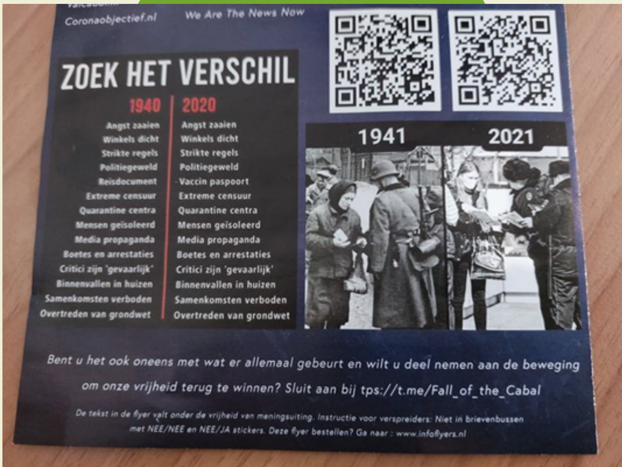
Screenshot 1: de folder 'Zoek het verschil 1940-2020'.