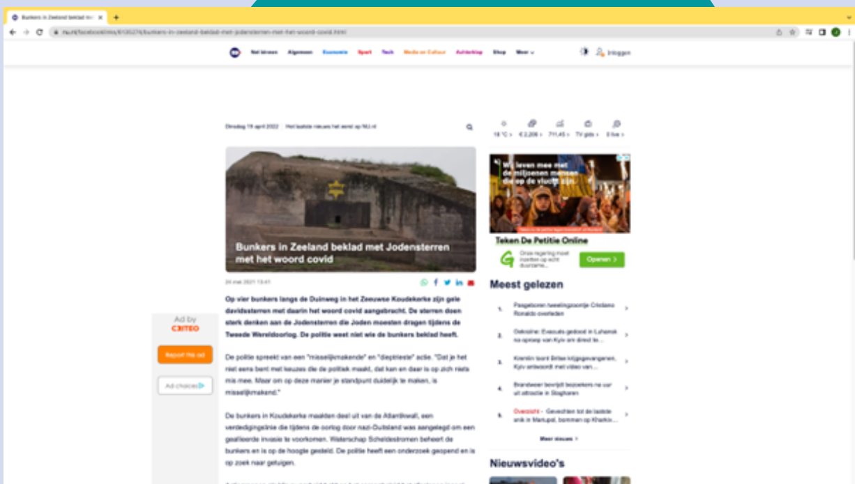
Screenshot 1: het artikel op nu.nl over de Jodensterren op de bunkers

Op 25 mei 2021 publiceerde de Nederlandse nieuwswebsite Nu.nl een artikel over bunkers in Zeeland met Jodensterren. Deze sterren waren beklad met het woord covid. Hieronder is het gehele artikel te lezen.